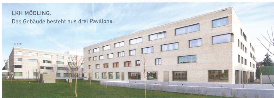
LKH MÖDLING. Das Gebäude besteht aus drei Pavillons.

Der Neubau des Landeskrinikums Mödling besteht aus drei Pavillons. Nachdem im Jahr 2015 der Pavillon A in Betrieb ging, folgten die Pavillons B und C. Als letzte Phase starteten nun der Abbruch des Altbaubestands sowie die Errichtung der Tiefgarage. Den Planern der Arge Katzberger, Loudon, Habeler & Partner, Moser Architekten und Architekt Franz Pfeil war vor allem ein durch Übersichtlichkeit und Eindeutigkeit geprägtes Wegenetz wichtig. Ziel war es weiter, das architektonische Grundkonzept lichtdurchflutet und ergonomisch sinnvoll zu strukturieren.