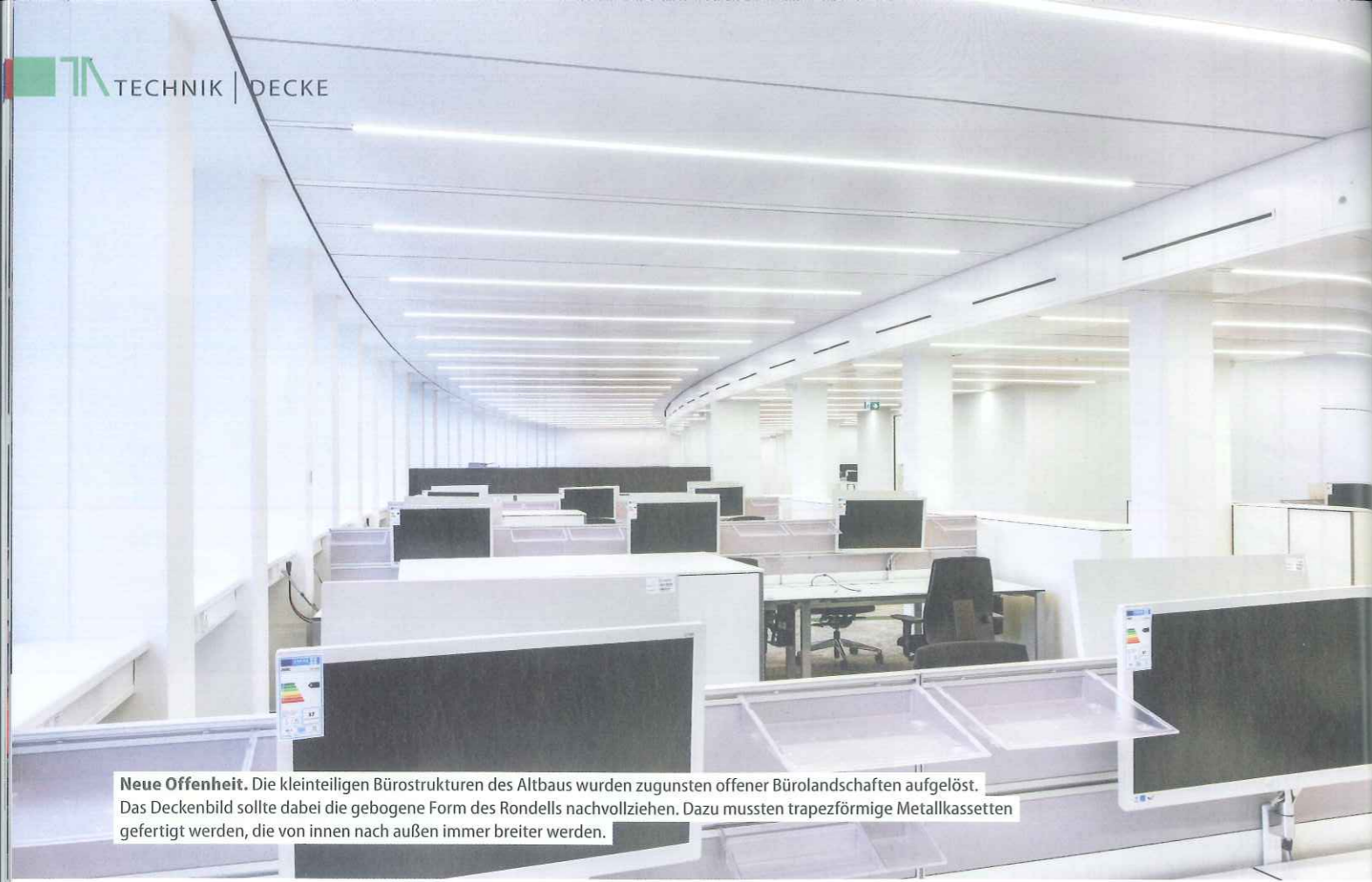
Neue Offenheit. Die kleinteiligen Bürostrukturen des Altbaus wurden zugunsten offener Bürolandschaften aufgelöst. Das Deckenbild sollte dabei die gebogene Form des Rondells nachvollziehen. Dazu mussten trapezförmige Metallkassetten gefertigt werden, die von innen nach außen immer breiter werden.