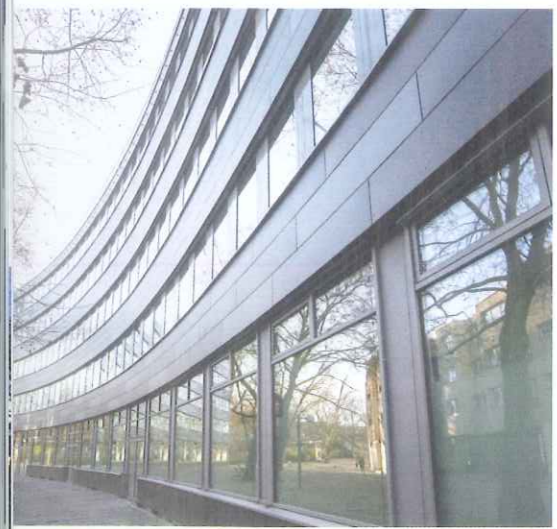
Zurückhaltend grau. Die Fassade wurde mit der Biegung des Gebäudes angepassten, gebogenen Eternitplatten in drei Grautönen gestaltet.

Metall-/Kühldecken | „Open Space“ ist die Idee hinter der Generalsanierung der AOK Nordost in Berlin. Nach der Entkernung entstanden weite Büroflächen, die großflächig u. a. auch mit kombinierten Heiz-/Kühl-Akustikdecken ausgestattet wurden. Die Herausforderung dabei war die gebogene Form des Gebäudes, die trapezförmige Kassetten und ein exaktes Fugenbild verlangte.