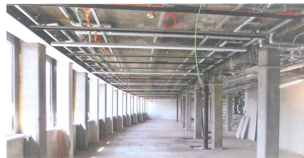
Vermessung outsourced. Aufgrund eines gewünschten schmalen Fugenbilds musste die Unterkonstruktion im Vorfeld millimetergenau sein. Dafür wurde extra ein Vermessungsbüro beauftragt, das ca. 250 Achspunkte vor Beginn der Montagearbeiten in allen Etagen eingemessen hat.

die inneren und äußeren Felder je zwölf unterschiedliche Kassettenpositionen notwendig. Die Ausrichtung des Deckenrasters verläuft quer zum Raum. Die Kassettenfelder sind mit quer durch alle Bereiche verlaufenden LED-Lichtbändern markant strukturiert. Die Lichtbänder sind durch je zwei Kassettenbreiten voneinander ge-